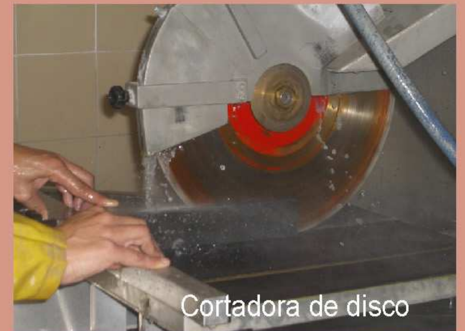
Cortadora de disco