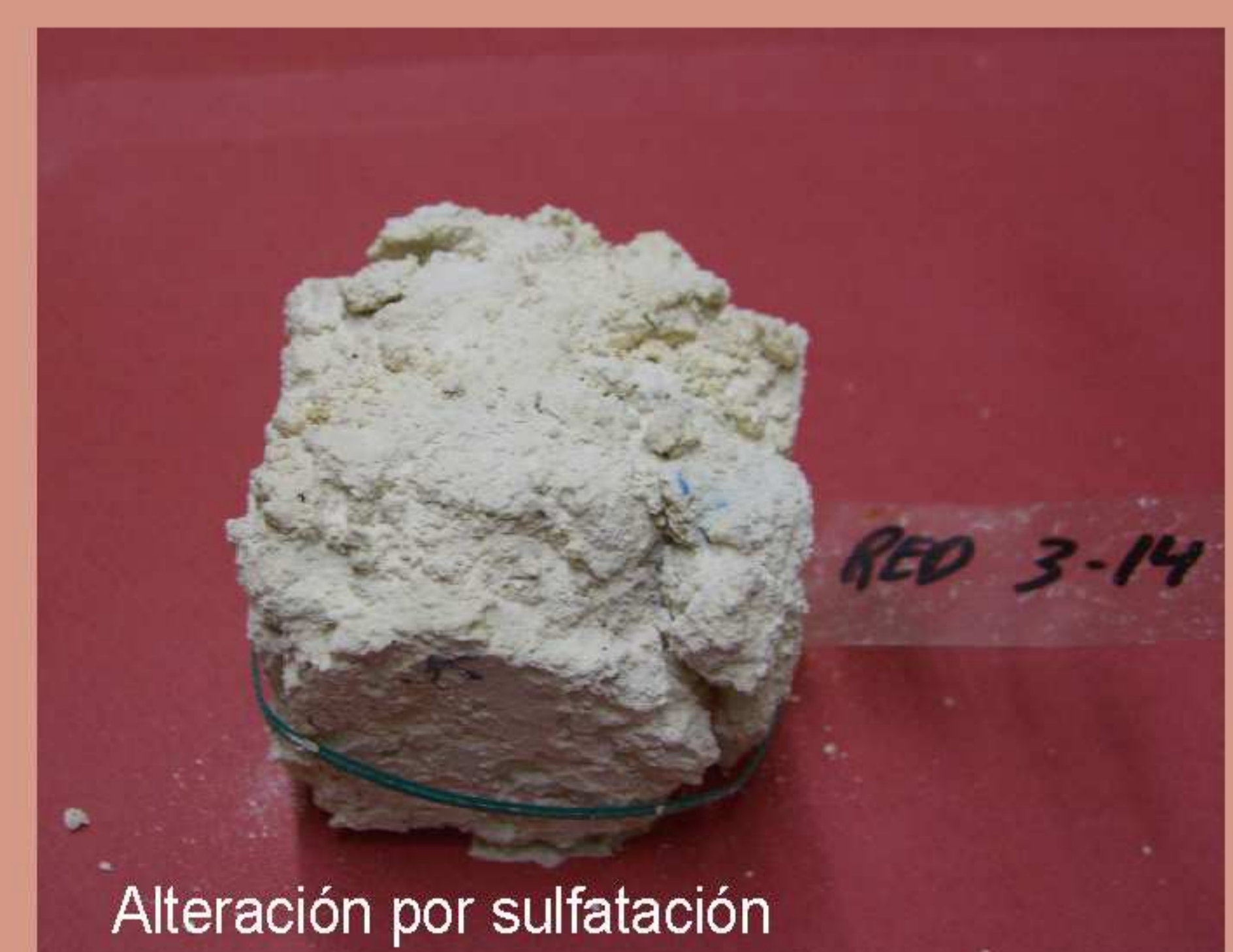
Alteración por sulfatación