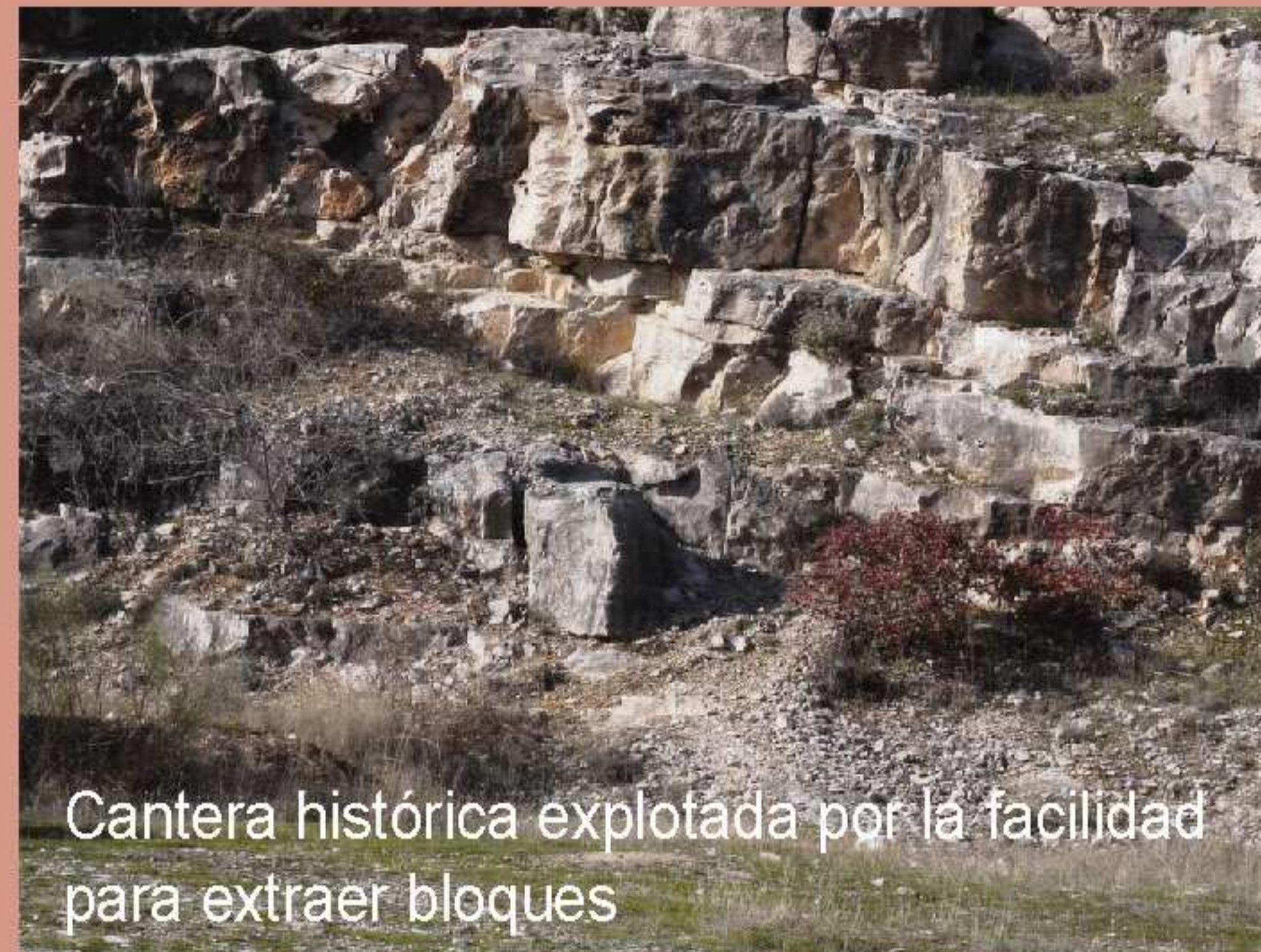
Cantera histórica explotada por la facilidad para extraer bloques