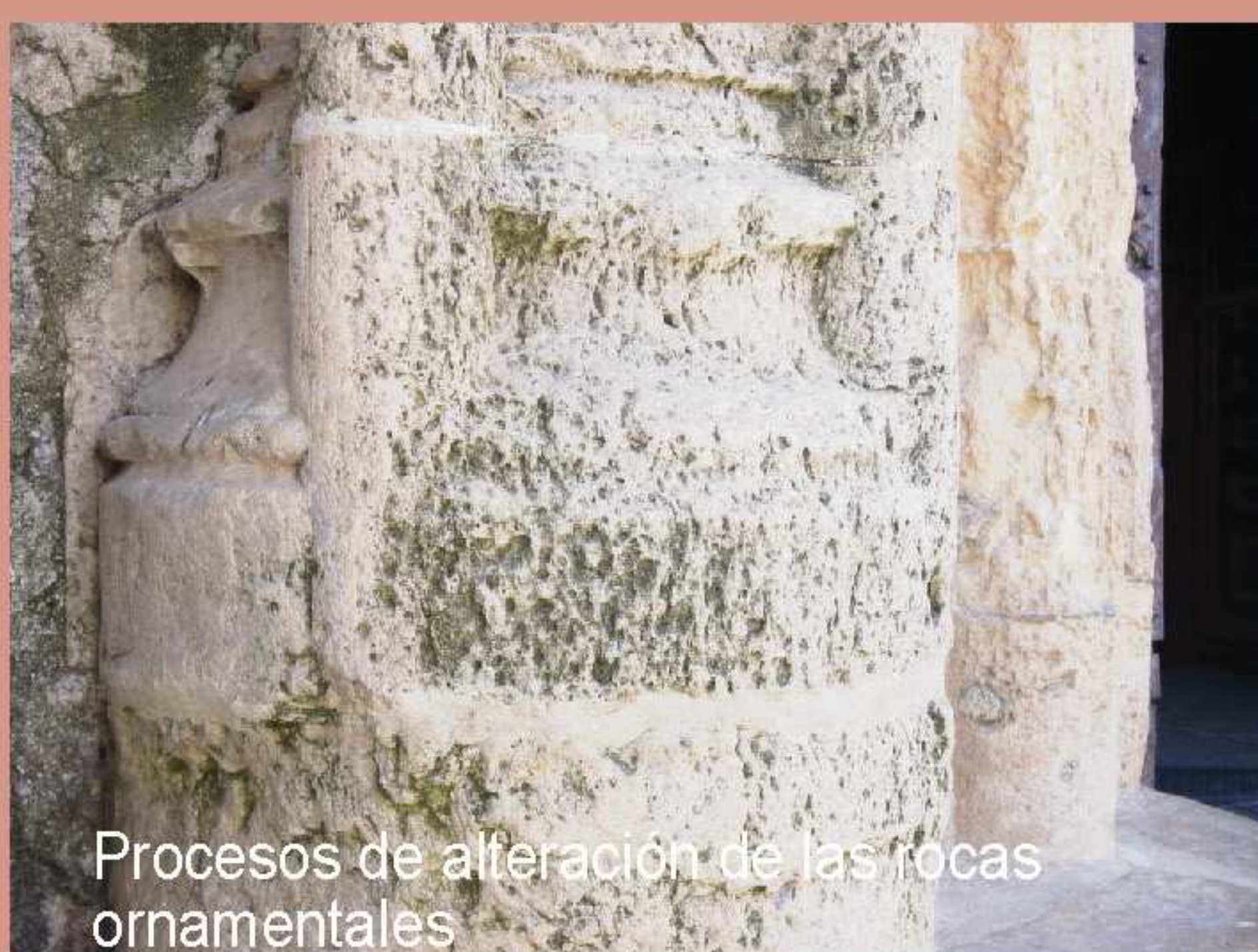
Procesos de alteración de las rocas ornamentales