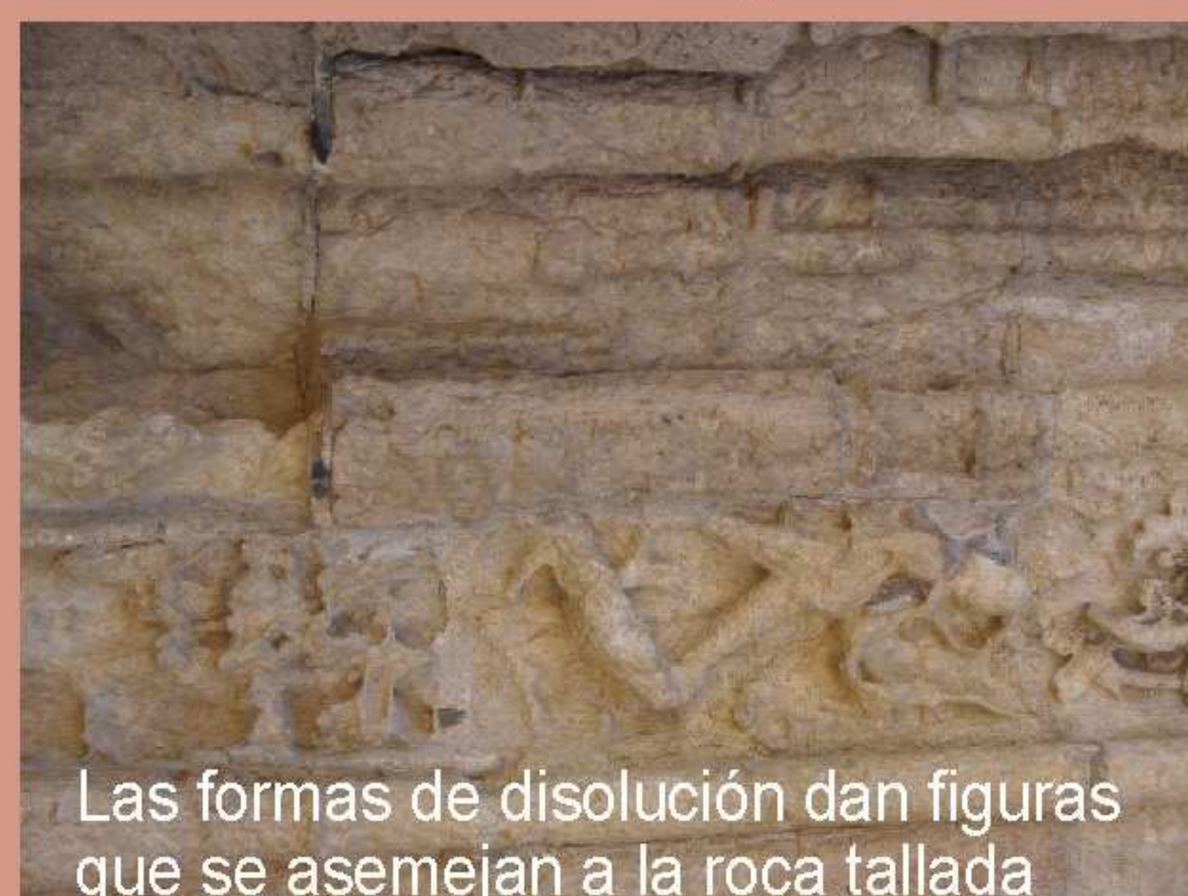
Las formas de disolución dan figuras que se asemejan a la roca tallada