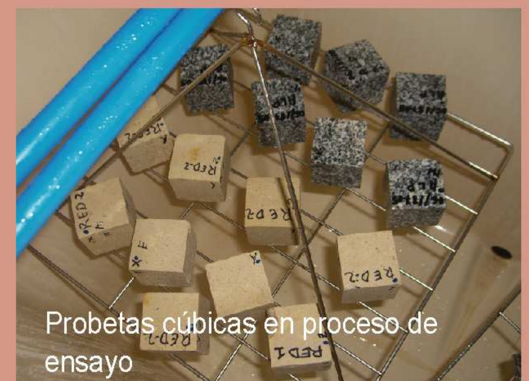
Probetas cúbicas en proceso de ensayo

Además, desarrolla investigaciones en el campo metodológico de nuevos análisis y ensayos. Colabora con instituciones públicas y privadas en la realización de proyectos, trabajos de investigación, tesis doctorales, asesoramientos técnicos, etc.